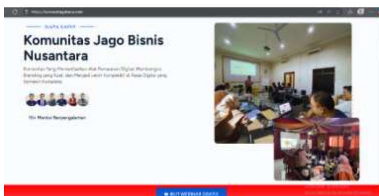
Gambar 5. Tampilan website komunitas jabnus.com sebagai media promosi agency JABIS

Website utama digunakan sebagai pusat informasi umum perusahaan, sedangkan landing page agency ( kemitraan.jabis.id ) dimanfaatkan untuk menjaring mitra dan klien potensial. Adapun komunitas digital JABIS digunakan untuk membangun engagement yang lebih erat dengan alumni dan pelaku UMKM binaan.