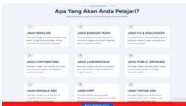
Gambar 6. Jasa pelatihan dan pelayanan dari PT JABIS

Produk yang ditawarkan adalah jasa pelatihan digital marketing dan layanan agency digital , termasuk desain konten, manajemen media sosial, landing page, dan iklan berbayar. Layanan ini bersifat fleksibel, dapat disesuaikan dengan kebutuhan UMKM dan skala bisnisnya.