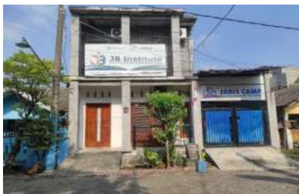
Gambar 1. Lokasi PT Jago Bisnis Nusantara

Dalam kajian teori, strategi pemasaran digital erat kaitannya dengan konsep Segmentation, Targeting, Positioning (STP) dan Marketing Mix . STP menekankan pentingnya membidik segmen pasar yang spesifik, memilih target konsumen yang tepat, serta menempatkan merek secara jelas di benak konsumen. Sementara itu, bauran pemasaran menyediakan kerangka dalam mengatur produk, harga, tempat, promosi, dan elemen lain yang harus disesuaikan dengan kebutuhan pasar modern (Luthfiandana et al., 2024). Kedua konsep ini menjadi dasar penting dalam merancang strategi digital marketing yang efektif.