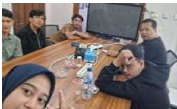
Gambar 2. Observasi aktivitas promosi digital PT Jago Bisnis Nusantara

PT Jago Bisnis Nusantara (JABIS) merupakan perusahaan yang bergerak di bidang pengembangan usaha mikro, kecil, dan menengah (UMKM) dengan menyediakan dua layanan utama, yaitu pelatihan digital marketing dan jasa agency. Kehadiran JABIS didorong oleh kebutuhan UMKM untuk meningkatkan daya saing melalui pemanfaatan media sosial sebagai sarana promosi. Dalam konteks penelitian ini, media sosial Instagram dipilih sebagai fokus utama karena menjadi kanal paling aktif digunakan perusahaan untuk mempublikasikan konten promosi.