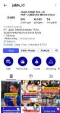
Gambar 3. Tampilan Akun Instagram @jabis_id (Fokus pada Layanan Pelatihan)

Salah satu bentuk implementasi strategi ini adalah dengan membuat akun baru @jbdigitalagency_ yang difokuskan secara eksklusif untuk mempromosikan layanan agency. Dengan demikian, pesan komunikasi dapat lebih terarah dan branding masing-masing layanan menjadi lebih jelas. Hal ini juga mendukung upaya diferensiasi merek agar tidak terjadi tumpang tindih dalam persepsi audiens.