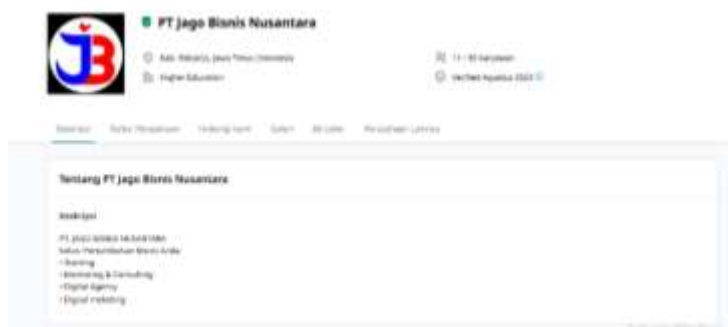
Gambar 9. Landing page PT Jago Bisnis Nusantara

Selain melalui Instagram, layanan agency juga dipromosikan melalui platform lain seperti landing page kemitraan.jabis.id, website utama jabis.id, dan komunitas digital komunitasjabnus.com. Strategi integrasi ini menciptakan pengalaman pengguna yang konsisten dan memperkuat citra profesional perusahaan di mata calon klien. Pendekatan ini sejalan dengan konsep omnichannel branding , yaitu konsistensi pesan lintas platform digital sebagai kunci utama dalam membangun kepercayaan dan loyalitas audiens (Isnaini et al., 2024).