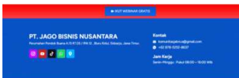
Gambar 7. Platform atau kanal komunikasi digital PT JABIS

Seluruh layanan bersifat digital. Pendaftaran pelatihan dan permintaan jasa dilakukan melalui website resmi ( jabis.id ), komunitas ( komunitasjabnus.com ), dan media sosial. Komunikasi dilakukan via WhatsApp, email, dan form digital.