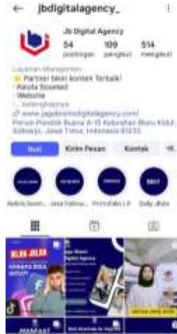
Gambar 4. Tampilan Akun Instagram @jbdigitalagency_ (Fokus pada Layanan Agency)

Gambar 3. menunjukkan akun utama @jabis_id yang lebih banyak menampilkan konten pelatihan digital marketing, sedangkan Gambar 4. memperlihatkan akun baru @jbdigitalagency_ yang difokuskan untuk membangun citra layanan agency secara lebih spesifik. Pemisahan ini menjadi bagian dari strategi segmentasi konten agar pesan komunikasi lebih terarah dan diferensiasi brand semakin jelas.