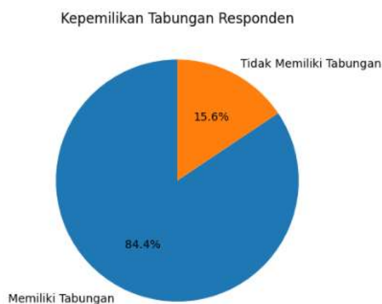
Gambar 1. Kepemilikan tabungan responden

Penelitian dilakukan melalui pembagian formulir kepada 30 remaja di Lamongan yang berusia antara 19 tahun hingga 22 tahun. Berikut adalah persentase usia responden dalam penelitian ini. Dengan menggunakan media Google Form yang telah disebar, rata-rata usia responden adalah 19 tahun. Pada usia ini, mereka sudah memasuki perguruan tinggi dan seharusnya sudah memahami perkembangan dunia perbankan. Di usia tersebut, penting bagi mereka untuk memiliki pola pikir yang baik mengenai pentingnya menabung untuk masa depan.