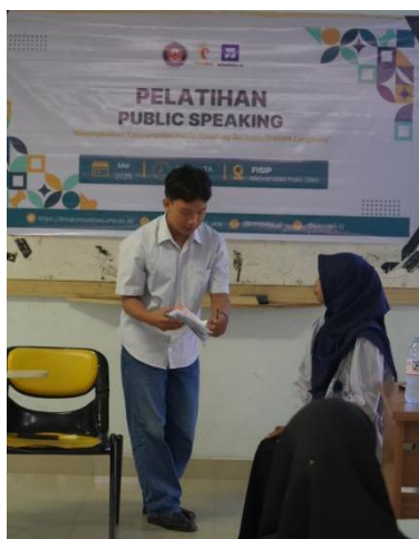
Gambar 2. Pelatihan dan praktik langsung public speaking

Setelah sesi penyampaian materi teori selesai, kegiatan dilanjutkan dengan pelatihan dan praktik langsung yang menjadi inti dari program pengabdian. Sesi ini dirancang untuk memberikan kesempatan kepada peserta dalam menerapkan berbagai konsep dan teknik public speaking yang telah dipelajari sebelumnya. Kegiatan diawali dengan latihan perkenalan diri di depan kelompok sebagai bentuk latihan dasar untuk melatih keberanian berbicara di hadapan audiens. Meskipun sederhana, aktivitas ini mampu membantu peserta mengurangi rasa gugup serta membangun kepercayaan diri sebelum mengikuti latihan yang lebih kompleks.