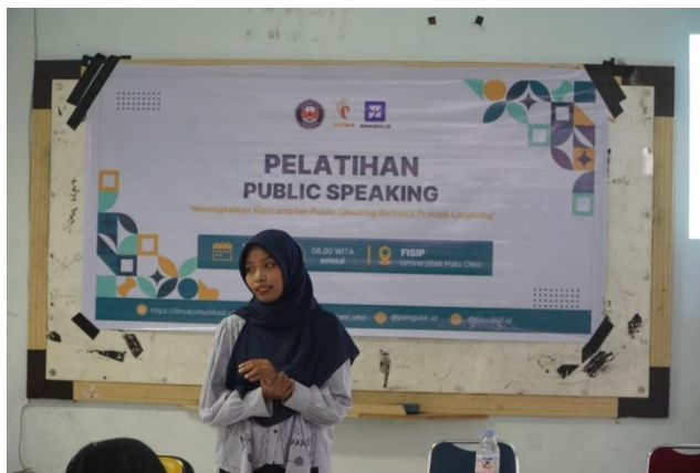
Gambar 1. Penyampaian materi