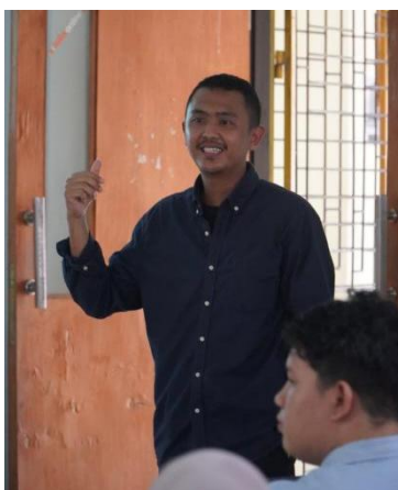
Gambar 3. Evaluasi