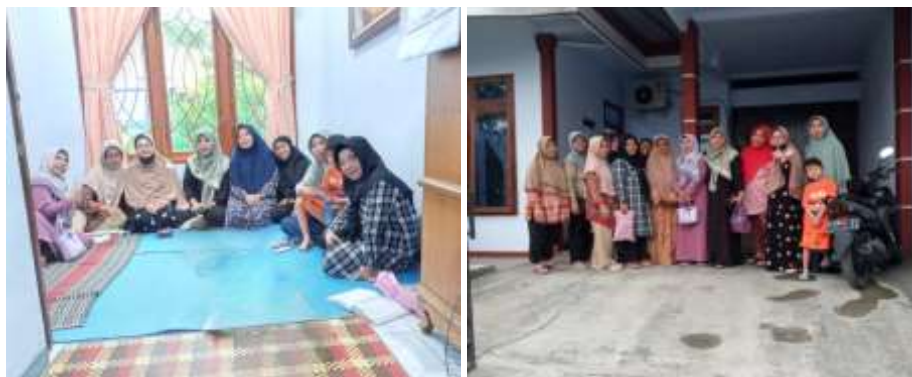
Gambar 1. Pelaksanaan kegiatan pengabdian masyarakat (tahap tiga)

Berdasarkan hasil pelaksanaan kegiatan pengabdian kepada masyarakat yang telah dipaparkan sebelumnya secara keseluruhan, kegiatan ini memperoleh respon yang sangat positif dari para peserta. Para peserta menunjukkan antusiasme yang tinggi selama mengikuti seluruh rangkaian kegiatan. Hal ini tercermin dari partisipasi aktif mereka dalam setiap sesi serta hasil evaluasi yang menunjukkan pemahaman dan keterampilan yang baik dalam pengelolaan keuangan keluarga setelah diberikan sosialisasi (Gambar 1). Selain itu, peserta pelatihan menunjukkan kemampuan yang baik dalam menerapkan materi yang telah disampaikan. Mereka mampu menyusun pembukuan keuangan secara mandiri tanpa memerlukan bantuan langsung dari narasumber. Hal ini menunjukkan bahwa pelatihan yang diberikan efektif dalam meningkatkan pemahaman dan keterampilan peserta dalam mengelola keuangan keluarga secara praktis.