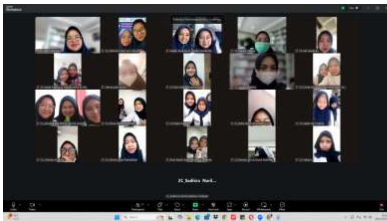
Gambar 2. Sesi diskusi Bersama mahasiswa

Selain sesi demonstrasi, kegiatan ini dilengkapi dengan sesi diskusi dan tanya jawab yang berlangsung melalui fitur chat dan audio. Mahasiswa diberi kesempatan untuk menyampaikan pertanyaan maupun kendala yang dihadapi selama penggunaan aplikasi. Interaksi yang terlihat dari keaktifan peserta dalam diskusi menunjukkan bahwa kegiatan berlangsung secara dua arah dan mendorong keterlibatan aktif antara pemateri dan mahasiswa.