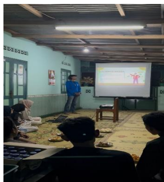
Gambar 2. Edukasi dan pengenalan pasar modal

melakukan pelatihan dan pendampingan kepada anggota Karang Taruna. Pengabdian memberikan edukasi mengenai pentingnya literasi keuangan serta pengenalan investasi sebagai alternatif pengelolaan keuangan yang lebih produktif. Pada tahap ini, kegiatan diawali dengan penyampaian materi dasar yang meliputi konsep literasi keuangan, perencanaan keuangan sederhana, serta pengenalan pasar modal dan instrumen investasi saham. Selanjutnya, pelatihan dilakukan dengan menggunakan aplikasi IDX Mobile melalui fitur virtual trading . Melalui media ini, peserta dapat melakukan simulasi jual beli saham secara langsung tanpa menggunakan dana riil. Peserta diajarkan cara membaca pergerakan harga saham, memahami mekanisme transaksi, serta melakukan analisis sederhana dalam memilih saham. Penggunaan aplikasi ini bertujuan untuk memberikan pengalaman jual beli secara langsung tanpa harus takut akan kerugian.