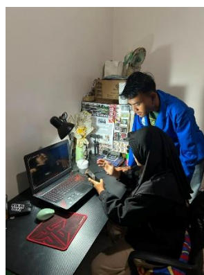
Gambar 3. Pendampingan Pendaftaran Akun RDN

Pada kegiatan selanjutnya, dilakukan pendampingan kepada anggota Karang Taruna untuk membuka akun RDN atau aplikasi sekuritas. Proses ini dimulai dari pendaftaran aplikasi sekuritas saham, pembuatan akun RDN, hingga siap melakukan jual beli saham. Dengan adanya aplikasi sekuritas diharapkan mereka mulai investasi dan meninggalkan kebiasaan bermain judi online. Sehingga diharapkan memiliki tabungan lebih untuk masa depan.